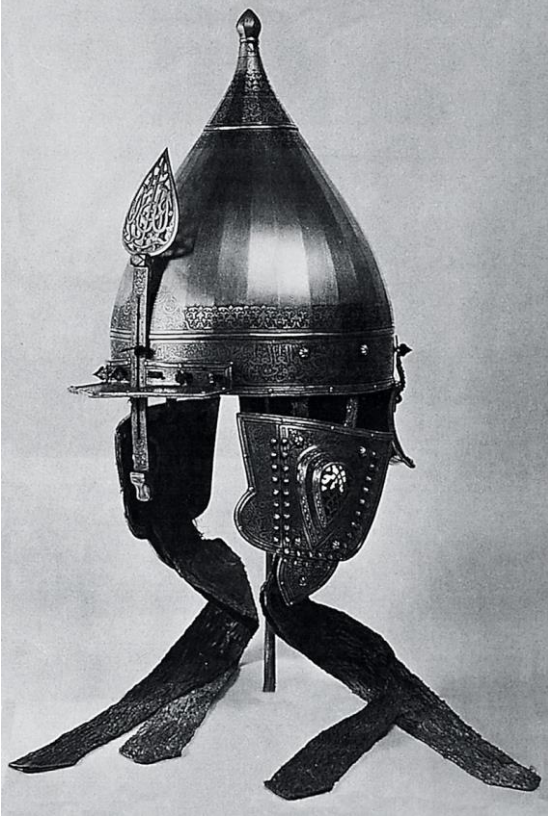
15.Yüzyıla ait Osmanlı Miğferi Münih Saatliches Müzesi